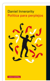
POLITICA PARA PERPLEJOS INNERARITY, DANIEL