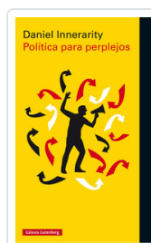
POLITICA PARA PERPLEJOS INNERARITY, DANIEL