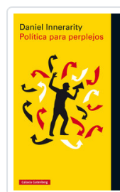
POLITICA PARA PERPLEJOS INNERARITY, DANIEL