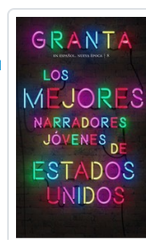
GRANTA ESPAÑOL NE, 8 MEJORES NARRADORES EE.UU. AA.VV.