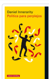
POLÍTICA PARA PERPLEJOS INNERARITY, DANIEL