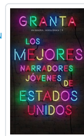
GRANTA ESPAÑOL NE, 8 MEJORES NARRADORES EE.UU. AA.VV.