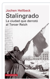
STALINGRADO (T) HELLBECK, JOCHEN