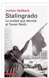
STALINGRADO (T) HELLBECK, JOCHEN