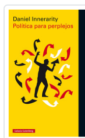
POLITICA PARA PERPLEJOS INNERARITY, DANIEL