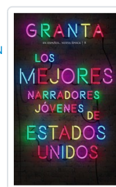
GRANTA ESPAÑOL NE, 8 MEJORES NARRADORES EE.UU. AA.VV.