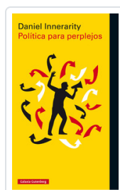
POLITICA PARA PERPLEJOS INNERARITY, DANIEL