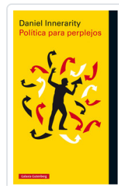
POLITICA PARA PERPLEJOS INNERARITY, DANIEL