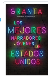
GRANTA ESPAÑOL NE, 8 MEJORES NARRADORES EE.UU. AA.VV.