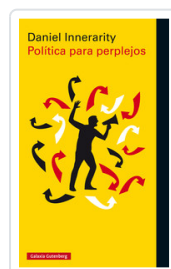
POLITICA PARA PERPLEJOS INNERARITY, DANIEL