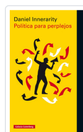
POLITICA PARA PERPLEJOS INNERARITY, DANIEL