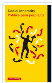
POLITICA PARA PERPLEJOS INNERARITY, DANIEL