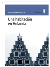
## HABITACION EN HOLANDA BERGOUNIOUX, PIERRE