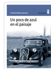
POCO DE AZUL EN EL PAISAJE BERGOUNIOUX, PIERRE