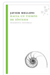
HACIA UN TIEMPO DE SINTESIS MELLONI, JAVIER