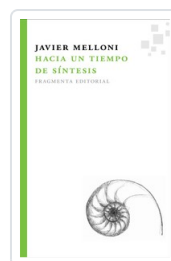
HACIA UN TIEMPO DE SINTESIS MELLONI, JAVIER