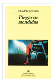
PLEGARIAS ATENDIDAS CAPOTE, TRUMAN