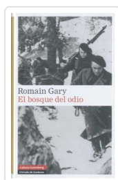
BOSQUE DEL ODIO GARY, ROMAIN