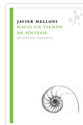
HACIA UN TIEMPO DE SINTESIS MELLONI, JAVIER