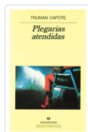
PLEGARIAS ATENDIDAS CAPOTE, TRUMAN