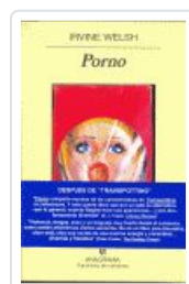
PORNO. WELSH, IRVINE