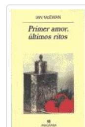
PRIMER AMOR, ÚLTIMOS RITOS