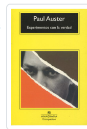
### EXPERIMENTOS CON LA VERDAD - CM AUSTER, PAUL