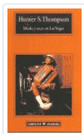
MIEDO Y ASCO EN LAS VEGAS - COMP- THOMPSON, HUNTER S