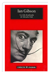
VIDA DESAFORADA DE SALVADOR DALI - GIBSON, IAN