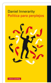
POLITICA PARA PERPLEJOS INNERARITY, DANIEL