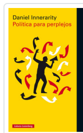
POLITICA PARA PERPLEJOS INNERARITY, DANIEL