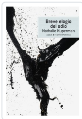
BREVE ELOGIO DEL ODIO KUPERMAN, NATHALIE