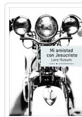
MI AMISTAD CON JESUCRISTO HUUMO, LARS