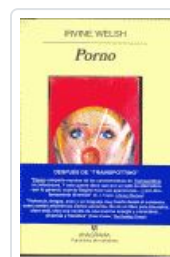
PORNO. WELSH, IRVINE