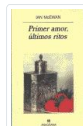
PRIMER AMOR, ÚLTIMOS RITOS