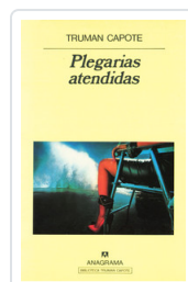
PLEGARIAS ATENDIDAS CAPOTE, TRUMAN