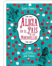
ALICIA EN EL PAIS DE LAS MARAVILLAS (NE) CARROLL, LEWIS