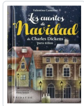
CUENTOS DE NAVIDAD, LOS CAMERINI, VALENTINA