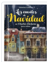
CUENTOS DE NAVIDAD, LOS CAMERINI, VALENTINA