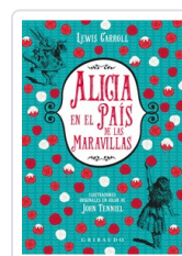
ALICIA EN EL PAIS DE LAS MARAVILLAS (NE) CARROLL, LEWIS