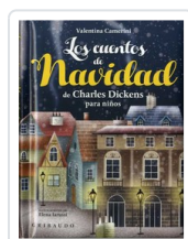
CUENTOS DE NAVIDAD, LOS CAMERINI, VALENTINA