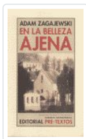
EN LA BELLEZA AJENA NCO-23 ZAGAJEWSKI, ADAM