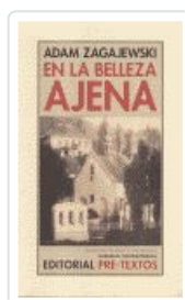
EN LA BELLEZA AJENA NCO-23 ZAGAJEWSKI, ADAM