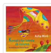
KOMAL Y LA COMETA DE COLORES MIRO, ASHA