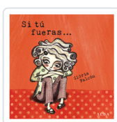
SI TU FUERAS FALCON, CLORIA