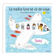
MEDIA LUNA SE VA DE VIAJE, LA SUSU