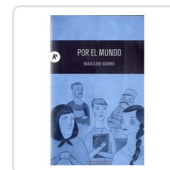
POR EL MUNDO GORKI, MAXIMO