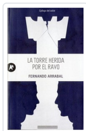
TORRE HERIDA POR EL RAYO ARRABAL, FERNANDO