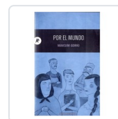
POR EL MUNDO GORKI, MAXIMO