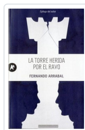
TORRE HERIDA POR EL RAYO ARRABAL, FERNANDO