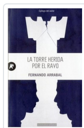
TORRE HERIDA POR EL RAYO ARRABAL, FERNANDO