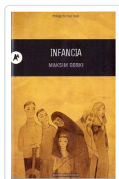
INFANCIA GORKI, MAXIMO