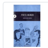
POR EL MUNDO GORKI, MAXIMO