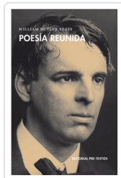
POESÍA REUNIDA -YEATS- YEATS, WILLIAM BUTLER