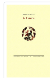
## O FUTURO GRAGERA, ABRAHAM