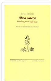
OBRA ENTERA POESIA Y PROSA 1958-1995 PT-874 CADENAS, RAFAEL