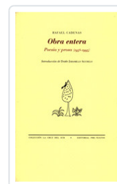
OBRA ENTERA POESIA Y PROSA 1958-1995 PT-874 CADENAS, RAFAEL