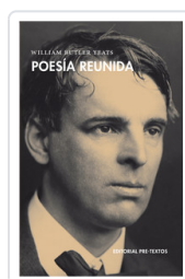
POESÍA REUNIDA - YEATS- YEATS, WILLIAM BUTLER