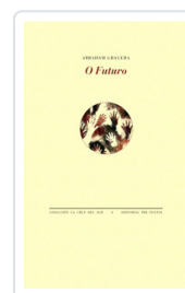
## O FUTURO GRAGERA, ABRAHAM