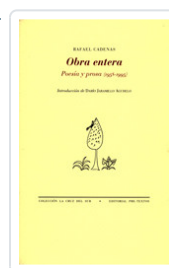
OBRA ENTERA POESÍA Y PROSA 1958-1995 PT-874 CADENAS, RAFAEL