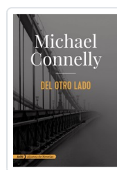
DEL OTRO LADO (ADN) MICHAEL CONNELLY