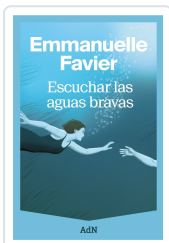
ESCUCHAR LAS AGUAS BRAVAS FAVIER, EMMANUELLE