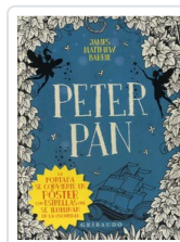
PETER PAN BARRIE, JAMES M.