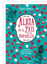
ALICIA EN EL PAIS DE LAS MARAVILLAS (NE) CARROLL, LEWIS