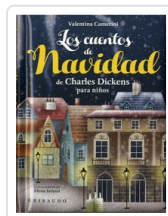
CUENTOS DE NAVIDAD, LOS CAMERINI, VALENTINA