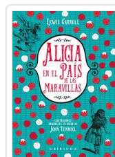
ALICIA EN EL PAIS DE LAS MARAVILLAS (NE) CARROLL, LEWIS