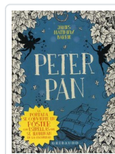
PETER PAN BARRIE, JAMES M.