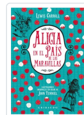
ALICIA EN EL PAIS DE LAS MARAVILLAS (NE) CARROLL, LEWIS