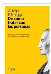
## DE COMO TRATAR CON PERSONAS KNGGE, ADOLPH