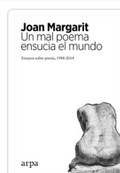
UN MAL POEMA ENSUCIA EL MUNDO MARGARIT, JOAN