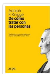
# DE COMO TRATAR CON PERSONAS KNGGE, ADOLPH