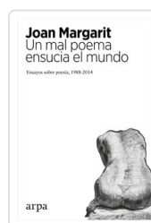
UN MAL POEMA ENSUCIA EL MUNDO MARGARIT, JOAN