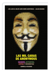
MIL CARAS DE ANONYMOUS, LAS COLEMAN, GABRIELLA