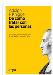
# DE COMO TRATAR CON PERSONAS KNGGE, ADOLPH