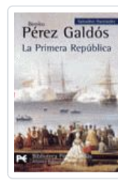
PRIMERA REPUBLICA BENITO PEREZ GALDOS