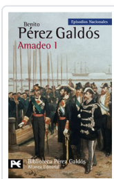
AMADEO I BENITO PEREZ GALDOS