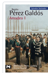
AMADEO I BENITO PEREZ GALDOS