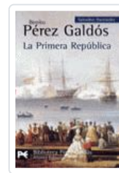
PRIMERA REPUBLICA BENITO PEREZ GALDOS