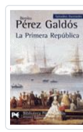
PRIMERA REPUBLICA BENITO PÉREZ GALDOS