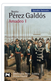
AMADEO I BENITO PÉREZ GALDOS